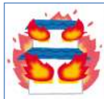
火災や消火時の水濡