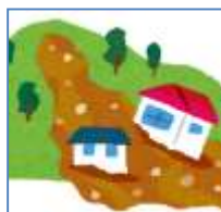
土砂崩れや川の氾濫