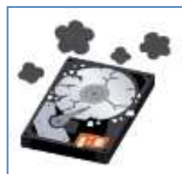
落下や転倒による破損