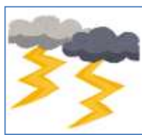
落雷による過電流等